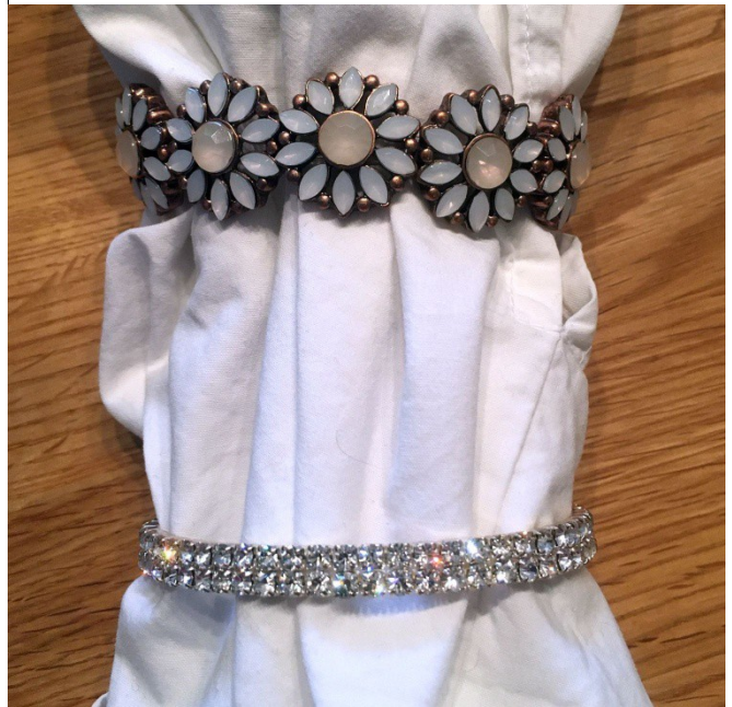
Gummizug-Armbänder, das untere ist echter Straß

Nachfolgend Detail-Ansichten der Ringe, siehe auch nächste Seite